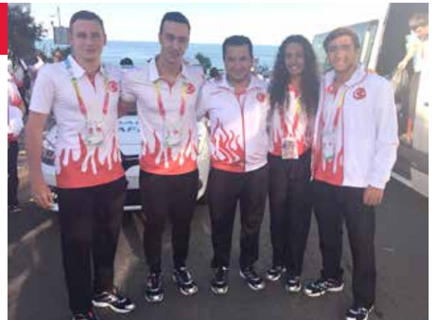
Dünya Okul Sporları Olimpiyatlarında Anabilimden Büyük Başarı!