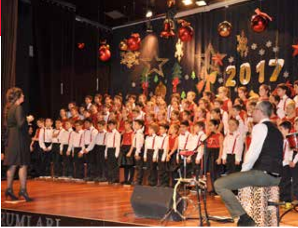
Geleneksel Yıl başı Konserleri'nde öğrencilerimizden muhteşem performans.