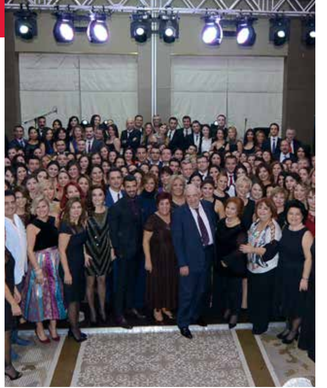
"İnci" yılına yakışır "Öğretmenler Günü" kutlaması.