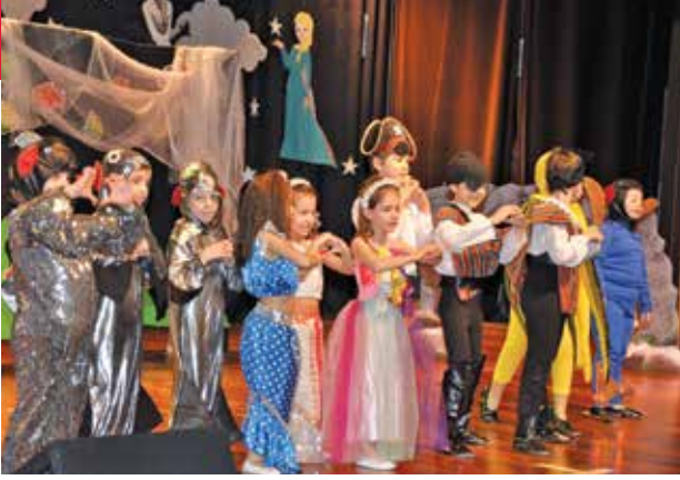
Bir varmış, bir yokmuş