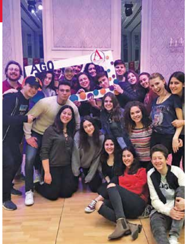
Anabilim Gençlik Organizasyonu Yoğun Katılımla Gerçekleşti