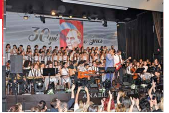
Anabilim 30. Yılı Kutladı